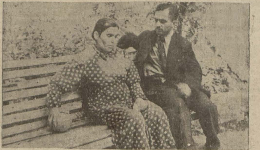
Tımarhane bahçe sinde bir mülakat

“Ben bir tımarhane kaçkınıyım” röportajı, bir gazetecinin kendisine deli süsü vererek girdiği tımarhanede bir müddet kaldıktan sonra yazdığı ve gazetemize sattığı fevkalâde güzel ve şayanı dikkat bir yazı silsilesidir. Şimdiye kadar mem-