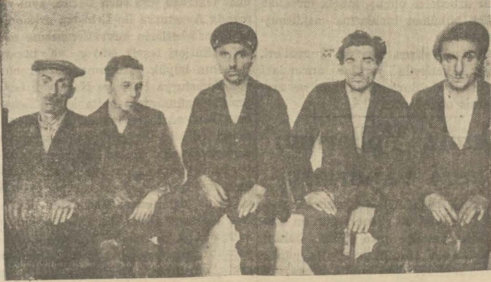
Geminin mürettebatı faciadan sonra

Geminin süvarisi geç vakte kadar şuurunu kaybetmiş bir halde idi, akşamüstü iyileşti ve "Ben ömrüme bu kadar kuvvetli cereyan görmedim," dedi