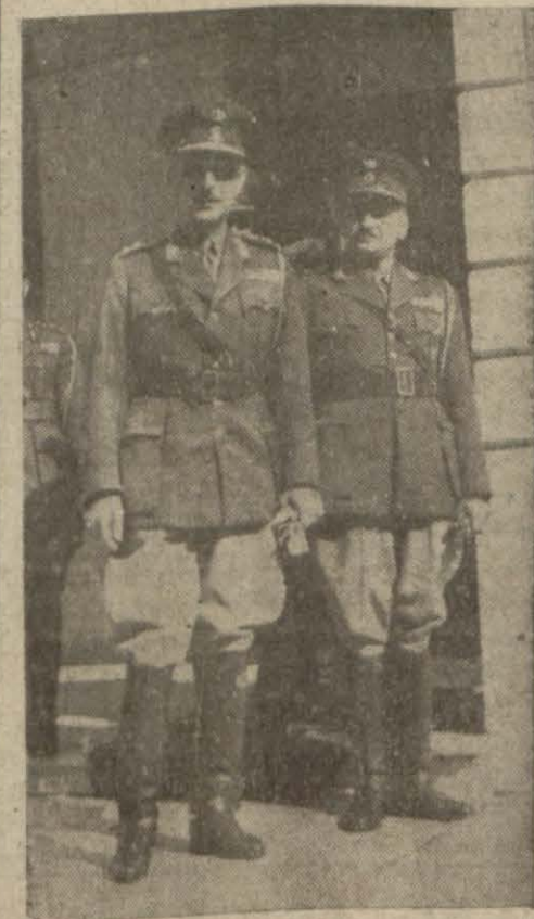
General Papagos vilâyette

Şehrimizde bulunan dost ve müttelik Yunan ordusunun genel kurmay başkanı General Papagos, dün saat 10,30 da vali Muhittin Üstündağ ve bilâhare İstanbul komutan vekilini ziyaret etmiştir. Öğleye doğru bu ziyaretler Perapalasta iade olunmuştur.