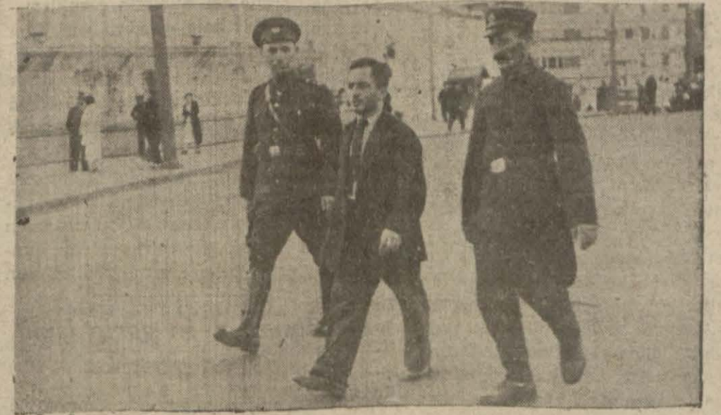
Muharrir çıldırıp yakalandıktan sonra Tıbbi Adliye götürülüyor.