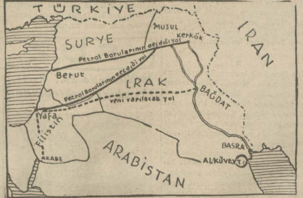
İngilterenin yaptırmaya karar verdiği yolların güzergâhını gösterir harita (Yazısı 11 nci sayfamızda)

İtalyanın kuvvetlenmiş olmasına rağmen Akdenizden çekilmemeye karar veren Büyük Britanya imparatorluğu bir taraftan yeni bir Hindistan yolu, diğer taraftan yeni bir Süveyş kanalı vücuda getiriyor