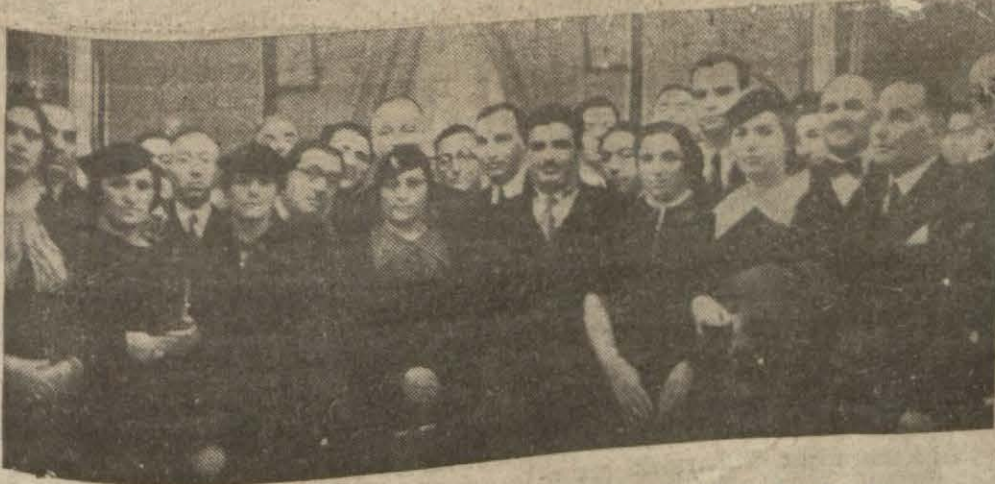
İran Hariciye Veziri şehrimizdeki İran kolonisi ile bir arada (Yazısı 2 inci sayfada)

İran kolonisini kabul eden, misafirimiz Türk - İran dostluk bağlarının kuvvetlendiğini söyledi