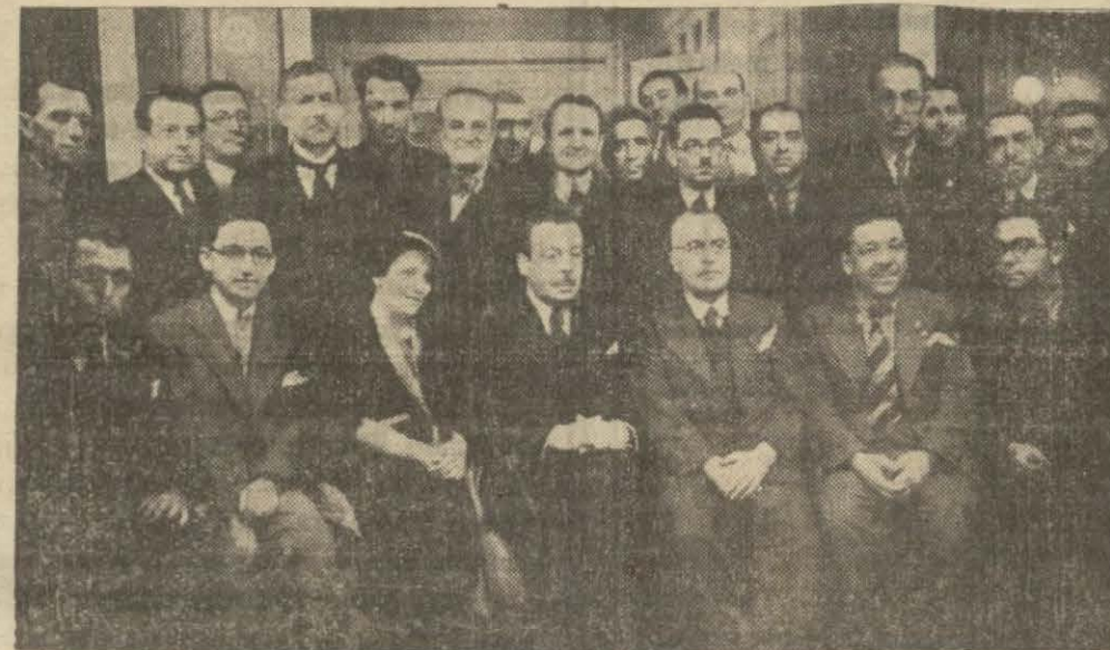
Türk - Elen gazetecileri bir arada